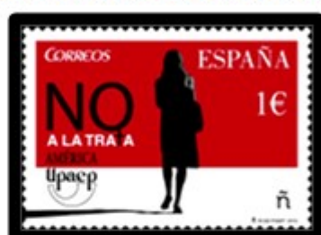
Lotta contro la tratta di esseri umani