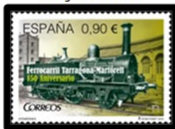
150° Anniversario della Ferrovia Tarragona-Martorell