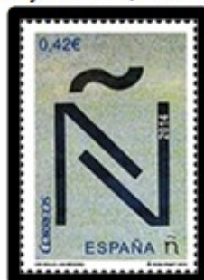
Un francobollo, un record