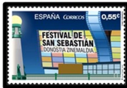
Festival di San Sebastiano